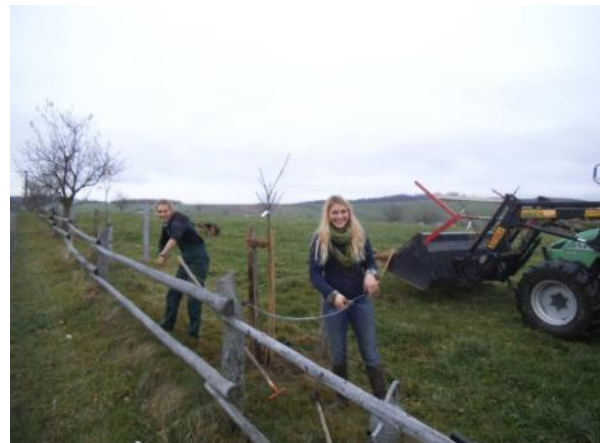
Bild: Bäume pflanzen